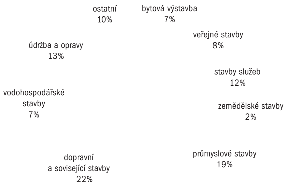
Graf 1. Spotřeba vápna podle odvětví (1997)